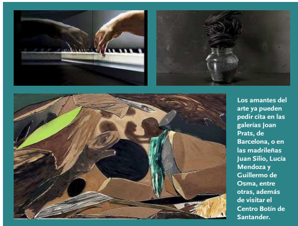
Los amantes del arte ya pueden pedir cita en las galerías Joan Prats, de Barcelona, o en las madrileñas Juan Silio, Lucía Mendoza y Guillermo de Osma, entre otras, además de visitar el Centro Botín de Santander.

Las galerías reabren sus puertas a medio gas y animan a coleccionistas y aficionados a volver a sus exposiciones, mientras los grandes museos se dan más tiempo y confían en tener visitantes en junio