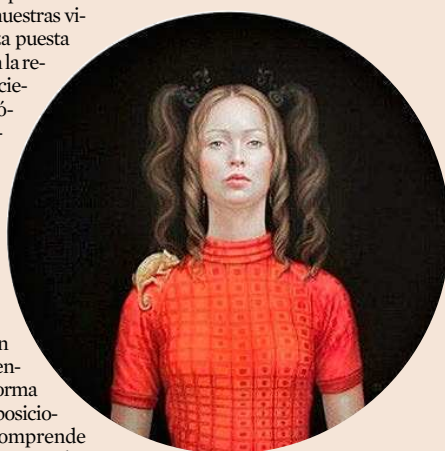
Salustiano. Galería Lucía Mendoza.